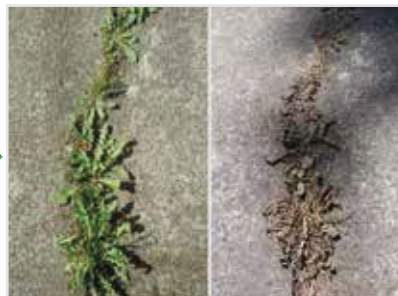
Før behandling 3 - 5 dage efter behandling